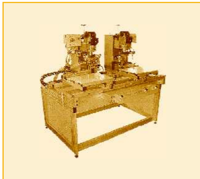
QI # TUM3B2202B

Machines pneumatiques à percer et à insérer pour pentures, plaques et patrons de perçage / Pneumatic operated drilling and insertion machines for hinges, mounting plates and line boring