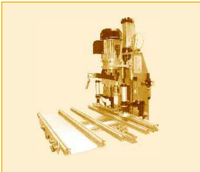
QI # TUM3B220-3